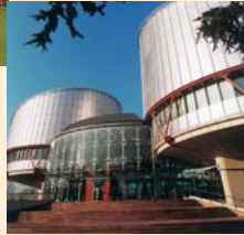
■ Le Palais des Droits de l'Homme ■ The Human Rights Building