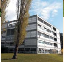
■ Centre européen de la Jeunesse ■ European Youth Center