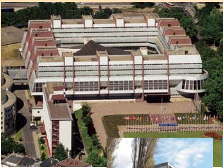
■ Vue aérienne du siège du Conseil de l'Europe ■ Aerial view of the Council of Europe headquarters