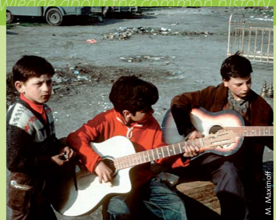
Publikacije: E roma ando Filmo

O Konsilo le Evropako kerdjas jekh sikavimasko seto vaš i xurdelin, jekh edukacionalno programo kerdo andar i preparacija e čhavengi te žan andi škola, (soske but roma, sinti, phirutne na žan ke xurdelin andar verver motivurja). E sikavimasko seto žutisarel te barjarel pes jekh intelektualno, emocionalno thaj socialno vazdipen ande romane komunitete vaš o keripen jekhe edukacionalno instrumentosko andar e čhave kaj si len 5 ži ko 7 berša. Kado edukacionalno žutimos del vast e čhaven te barjaren peske bazutne žanimata kaj treban len kana astaren te žan ande angluni škola, te žanen sar te sikljon, te sikaven e daden thaj e dajen pal o trebaipen e žanimasko, te barjarel e čhavengo žanipen pal i analiza thaj i kris thaj te zorjarel lengi imaginacija. E siklimasko seto arakhel pes sar jekh CD-Rom thaj si les fakturjenge lila vaš e individualne aktivitete thaj jekh metodologijako lil vaš o tutoro/ vaj o mediatoro.