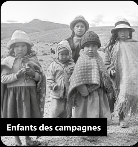
Enfants des campagnes