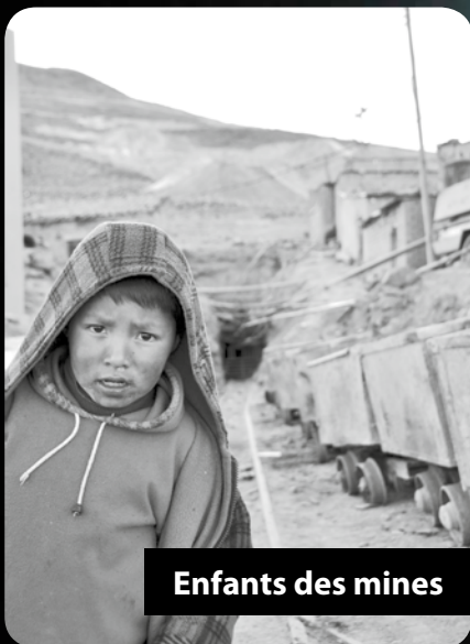
Enfants des mines

Objectif : 32'000 sacs de matériel scolaire pour les enfants des mines, des campagnes et des bidonvilles