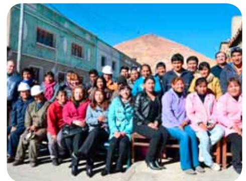
L'équipe de Potosi au pied des mines 4'200 m. d'altitude