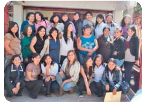
L'équipe de Cochabamba qui a lancé les campagnes contre la violence !

Formée en comptabilité, audit et gestion des achats, elle coordonne les campagnes de matériel scolaire dans les vallées les plus oubliées de Potosi.