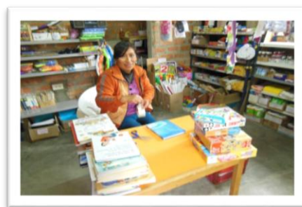
Plastification des livres par une femme du magasin