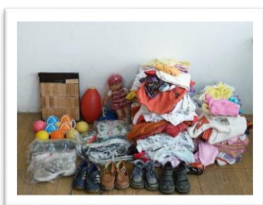
Vêtements et certains jeux acheminés

Nous remercions l'association Entraide Solidarités d'avoir uni ses efforts aux nôtres dans les actions décrites précédemment. Nous nous maintenons à votre disposition pour de plus amples informations sur le déroulement et la poursuite de ces projets.