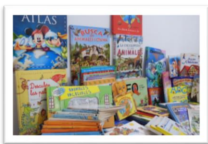
Les livres acheminés

- Prêts à domicile : L'association prévoit de créer un service de prêts à domicile dès mars 2014. Le but de ce projet serait de rendre les livres (produits de luxe) accessibles aux familles et de renforcer les liens (souvent fragiles ou tendus) entre l'école et le cadre familial. L'acheminement des livres constitue une étape importante dans la concrétisation de ce projet. L'idée n'est pas de se « contenter » des livres collectés à Strasbourg : une fois que la bibliothèque de prêts sera correctement organisée et fonctionnelle, d'autres collectes pourront être coordonnées entre les écoles privées de Lima et les établissements publics soutenus par Altiplano.