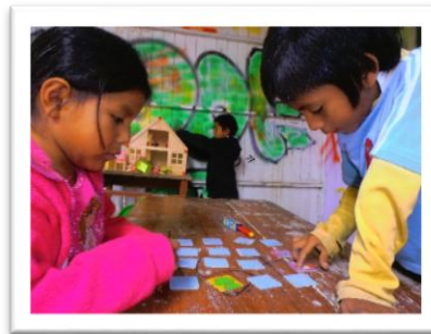
Ludothèque de l'école de Casuarinas à Pachacutec