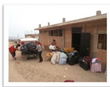
Local d'Altiplano – Salle où sont vendus les dons