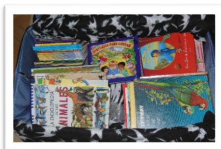
Photos des 4 valises de matériel