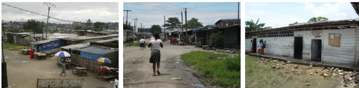
Vues du quartier Soboum et de l'école de la paroisse de l'église protestante

Dans ces contextes de grande précarité éducative, les mots de Mme. Irina BOKOVA, directrice générale de l'UNESCO à l'occasion de la Journée mondiale du livre qui se déroule chaque année le 23 avril, ont un écho tout particulier : « Les livres, comme forme matérielle au contenu immatériel, expriment la pensée d'un auteur et prennent un sens dans l'imagination des lecteurs. Ils témoignent ainsi de la capacité humaine d'invoquer des mondes réels et imaginaires et de les faire parler. Ce sont les meilleurs messagers de la tolérance, de vibrants signes d'espoir et les piliers des sociétés libres et ouvertes. Nous devons protéger les livres et rendre leur richesse accessible à tous ».