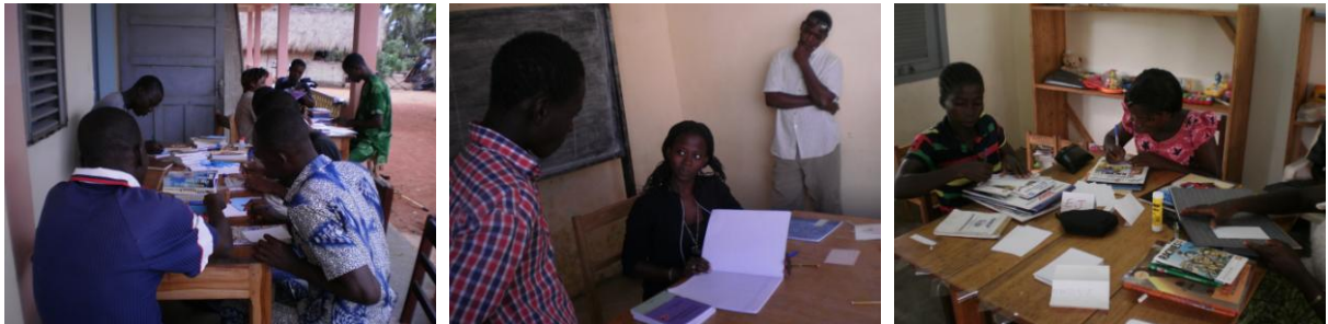
Découverte et classement d'ouvrages et exercices pratiques d'inventaire et de prêt des livres lors de formations de bibliothécaires au Bénin, au Sénégal et en Côte d'Ivoire