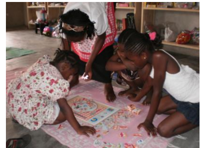
La ludothèque : une expérience unique au Cameroun d'éducation par le jeu encadrée par une ludothécaire locale

La ludothèque itinérante : Pour apporter des ressources financières supplémentaires à la ludothèque en vue de son autonomie et pour étendre l'éducation par le jeu à d'autres publics qui ne peuvent pas se rendre à la ludothèque du fait de leur éloignement, l'association AC-VEDES dont le président a suivi la formation de ludothécaire impartie par C.I.E.LO en 2011 et la ludothécaire organisent depuis juillet 2013 des animations ludiques itinérantes en direction des écoles maternelles et primaires ainsi que des paroisses. Cette activité a été rendue possible grâce à un financement ayant permis d'acquérir des jeux de grande taille lors d'un appel à projets lancé par C.I.E.LO au début 2013 dont la ludothèque camerounaise a été l'un des deux lauréats. A ce jour et après 5 sorties, la ludothèque itinérante et ses 2 animateurs indemnisés a déjà bénéficié à près de 550 enfants et a réalisé des bénéfices en faveur de la ludothèque équivalents à 35% du salaire mensuel de la ludothécaire.