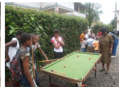
La « ludothèque itinérante » organisée selon un calendrier préétabli étend l'impact de la ludothèque et lui apporte des ressources supplémentaires