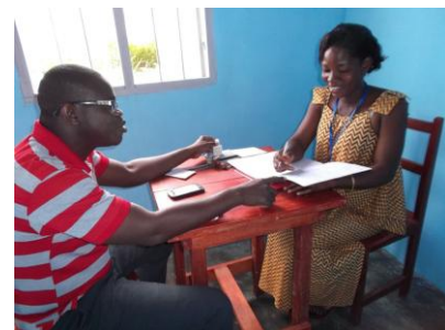
Formation de candidats bibliothécaires au Bénin, fonctionnement de la bibliothèque au Sénégal et la bibliothécaire lors d'un prêt de livre à domicile en Côte d'Ivoire