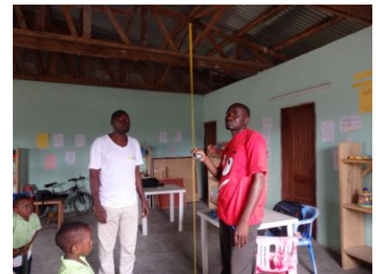
Le bâtiment construit par C.I.E.LO en 2011, l'espace intérieur de 95 mètres carrés et l'artisan local entrain de prendre des mesures pour élaborer le devis d'aménagement du local.