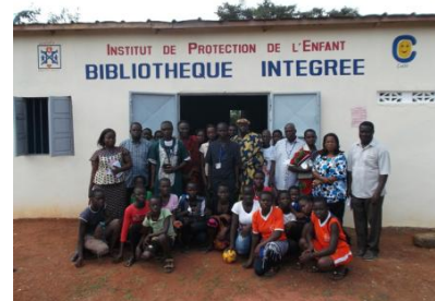
Les bibliothèques en fonctionnement au Bénin, au Sénégal et en Côte d'Ivoire