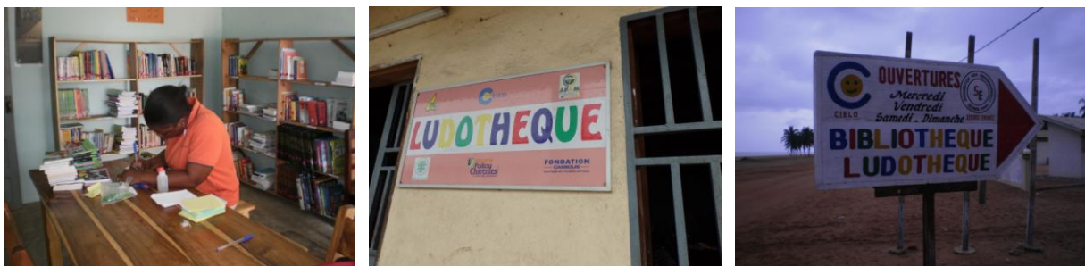
Le mobilier fabriqué au Cameroun sera très similaire à celui utilisé dans les autres bibliothèques de C.I.E.LO tout comme les panneaux indicateurs et de promotion

Le mobilier de la bibliothèque sera également fabriqué sur place par le même artisan responsable des travaux d'aménagement. Il sera constitué de 3 grandes tables (200x80x75cm) et de 6 bancs (200x30x45cm) pour la consultation des ouvrages sur place, d'un bureau (60x60x75cm) et de 2 chaises pour le prêt des livres à domicile et de 3 grandes étagères (160x200x30cm) de rangement des livres avec 4 niveaux de rangement. 2 panneaux indicateurs seront également fabriqués et placés en façade et dans les rues adjacentes et la mention « bibliothèque » sera rajoutée à celle de la ludothèque sur la façade du bâtiment.