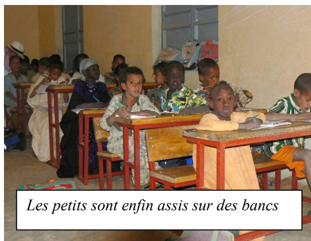
Les petits sont enfin assis sur des bancs