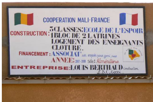
Logement des enseignants