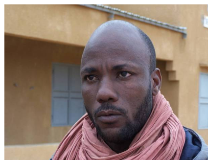
Directeur de l'école