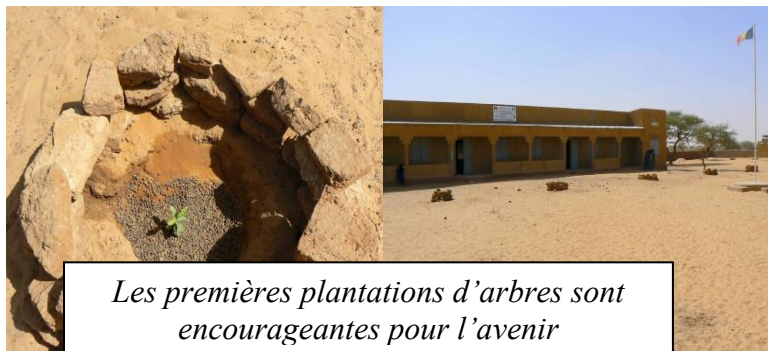
Les premières plantations d'arbres sont encourageantes pour l'avenir