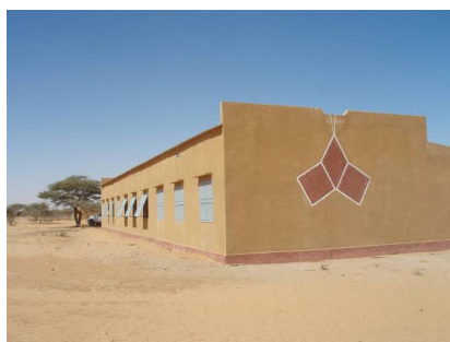
Ecole de l'espoir en janvier 2008

Une commande de mobiliers (tables, bancs et bureau) a été immédiatement passée par l'association aux ateliers diocésains de Sévaré.