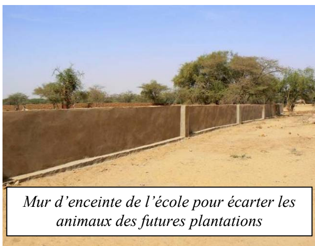
Mur d'enceinte de l'école pour écarter les animaux des futures plantations