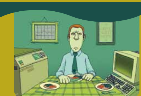
Η θετική άσκηση του γονικού ρόλου σημαίνει εξισορρόπηση της οικογενειακής και επαγγελματικής ζωής.