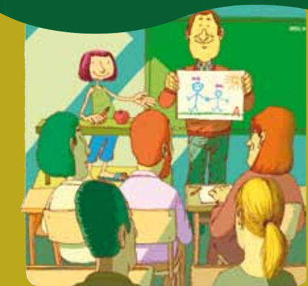
Η θετική άσκηση του γονικού ρόλου μπορεί να διδαχθεί.