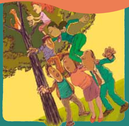
Τα δικαιώματα των παιδιών συμβάλλουν στην ανάπτυξη της οικογένειας.

Η θετική άσκηση του γονικού ρόλου αναφέρεται στη γονική συμπεριφορά που σέβεται τα συμφέροντα και τα δικαιώματα των παιδιών, όπως ορίζονται στη Σύμβαση των Ηνωμένων Εθνών για τα Δικαιώματα του Παιδιού - μια σύμβαση η οποία λαμβάνει επίσης υπόψη τις ανάγκες και τις δυνατότητες των γονιών. Η θετική άσκηση του γονικού ρόλου επιτυγχάνεται μέσω της στοργής, της ενδυνάμωσης, της καθοδήγησης και της αναγνώρισης των παιδιών ως ατόμων με δικά τους δικαιώματα. Η προώθηση της θετικής άσκησης του γονικού ρόλου δεν σημαίνει την ενθάρρυνση ανεκτικής γονικής συμπεριφοράς: ορίζει τα πλαίσια που χρειάζονται τα παιδιά στα οποία θα αναπτύξουν τις δυνατότητες τους στο μέγιστο. Η θετική άσκηση του γονικού ρόλου έχει τις ρίζες της στο σεβασμό των δικαιωμάτων των παιδιών και στην ανατροφή τους σ' ένα μη βίαιο περιβάλλον.