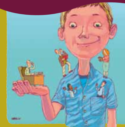
Τα δικαιώματα των παιδιών αφορούν όλους μας.