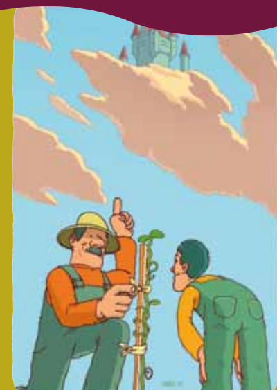
Τα παιδιά χρειάζονται καθοδήγηση για να αναπτύξουν τις δυνατότητες τους στο έπακρο.