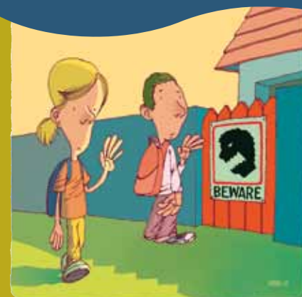
Οι γονείς χρειάζονται βοήθεια για να ξεπεράσουν το άγχος τους.